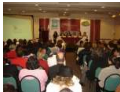
II Informe de Actividades. Cd. Juárez