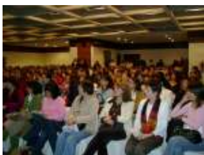
Día Internacional de la Mujer. Chihuahua.