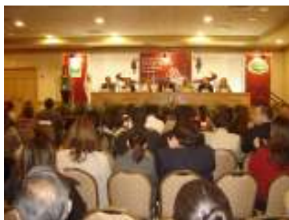
Día Internacional de la Mujer. Chihuahua.

• Con motivo de la conmemoración del Día Internacional de la Mujer el ICHMujer llevó a cabo eventos conmemorativos enmarcados con el tema: “La Independencia Económica de la Mujer como Medio de Empoderamiento”. En Parral el 2 de Marzo con la participación de 100 Mujeres y 25 Hombres. En Nuevo Casas Grandes el 6 de Marzo con la participación de 250 Mujeres Y 15 Hombres. En Chihuahua el 7 de Marzo con la participación de 350 Mujeres Y 45 Hombres. En Cd. Juárez el 9 de Marzo con la participación de 300 Mujeres Y 25 Hombres. Así mismo el 8 de Marzo se llevó a cabo un desayuno para 2000 mujeres presidido por el C. Gobernador del Estado, evento organizado en colaboración con la Secretaría de Fomento Social.