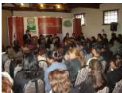
II Informe de Actividades. Nuevo Casas Grandes.