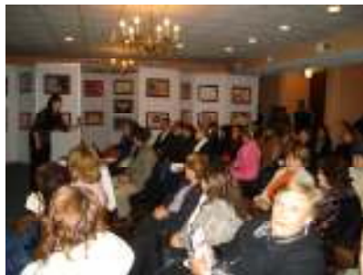
Conferencia “Vive Con Libertad Vive Sin Miedo”. H. del Parral.

• Se llevaron a cabo las conferencias “Vive Con Libertad Vive Sin Miedo” exhibiendo ahí mismo la muestra pictórica “Denuncia Artística”, resultado de los talleres del mismo nombre impartidos en 11 municipios del Estado durante el 2006. El 31 de Enero del año en curso en la Cd. de Parral se contó con la asistencia de 66 mujeres y 5 hombres. El 7 de Febrero en Chihuahua se llevó a cabo en las instalaciones de La Casa Chihuahua teniendo una asistencia de 59 mujeres y 2 hombres.