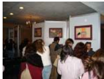
Conferencia “Vive Con Libertad Vive Sin Miedo”. H. del Parral.