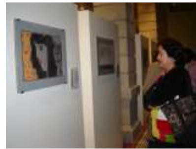
Conferencia “Vive Con Libertad Vive Sin Miedo”. Chihuahua.