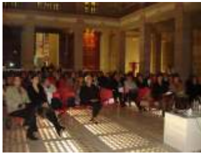
Conferencia “Vive Con Libertad Vive Sin Miedo”. Chihuahua.