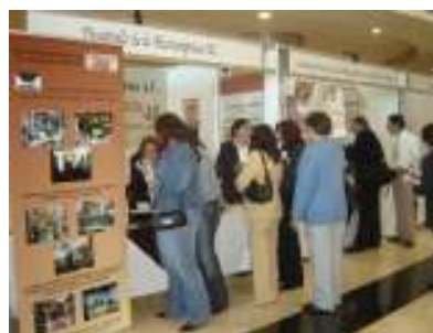
Día Internacional de la Mujer. Chihuahua.