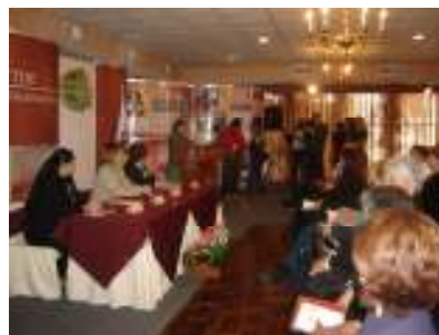
II Informe de Actividades. H. Del Parral