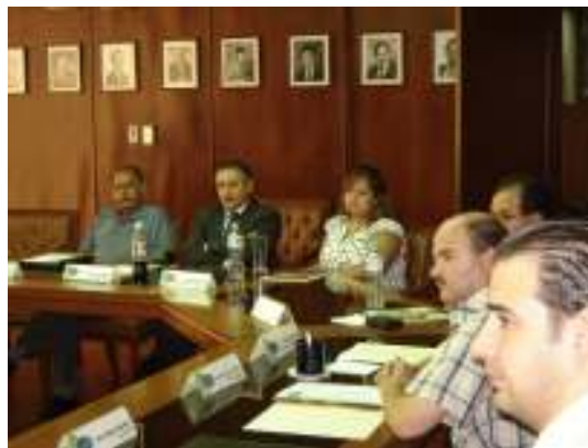
Cuarta Sesión Ordinaria del Consejo Directivo