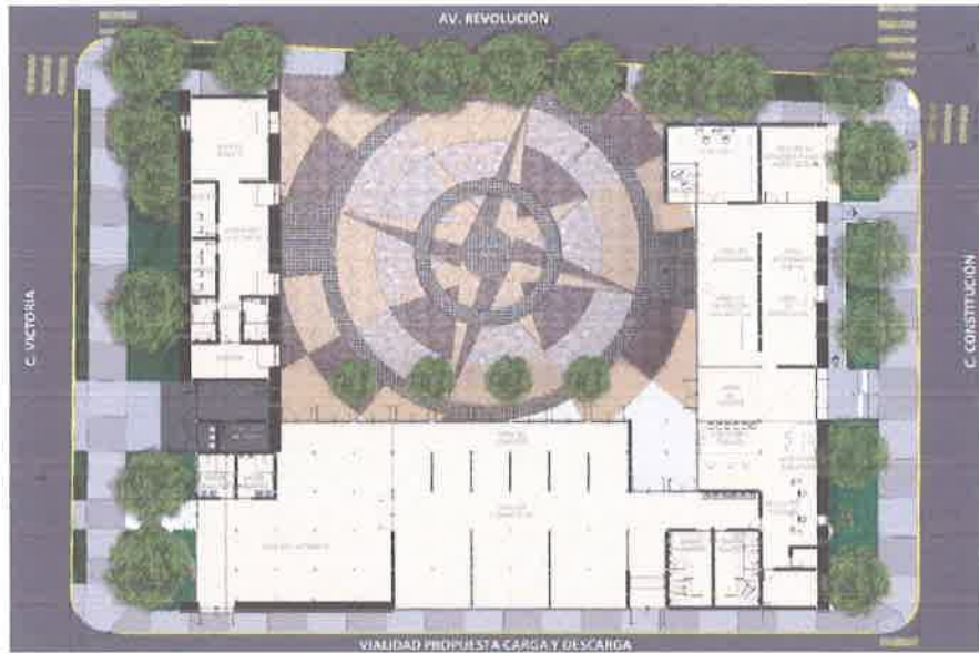
CENTRO DE BIENVENIDA DE VISITANTES VISTA PANORAMICA