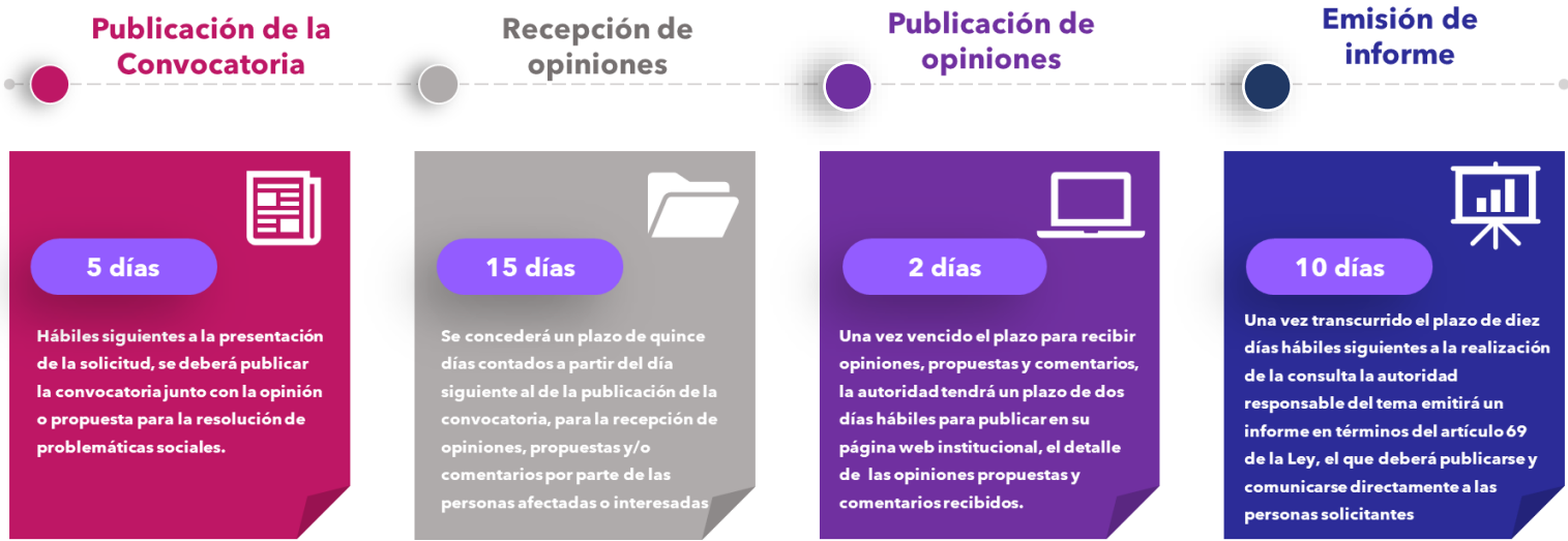
Esquema de tiempos desde la Convocatoria hasta la emisión del informe.